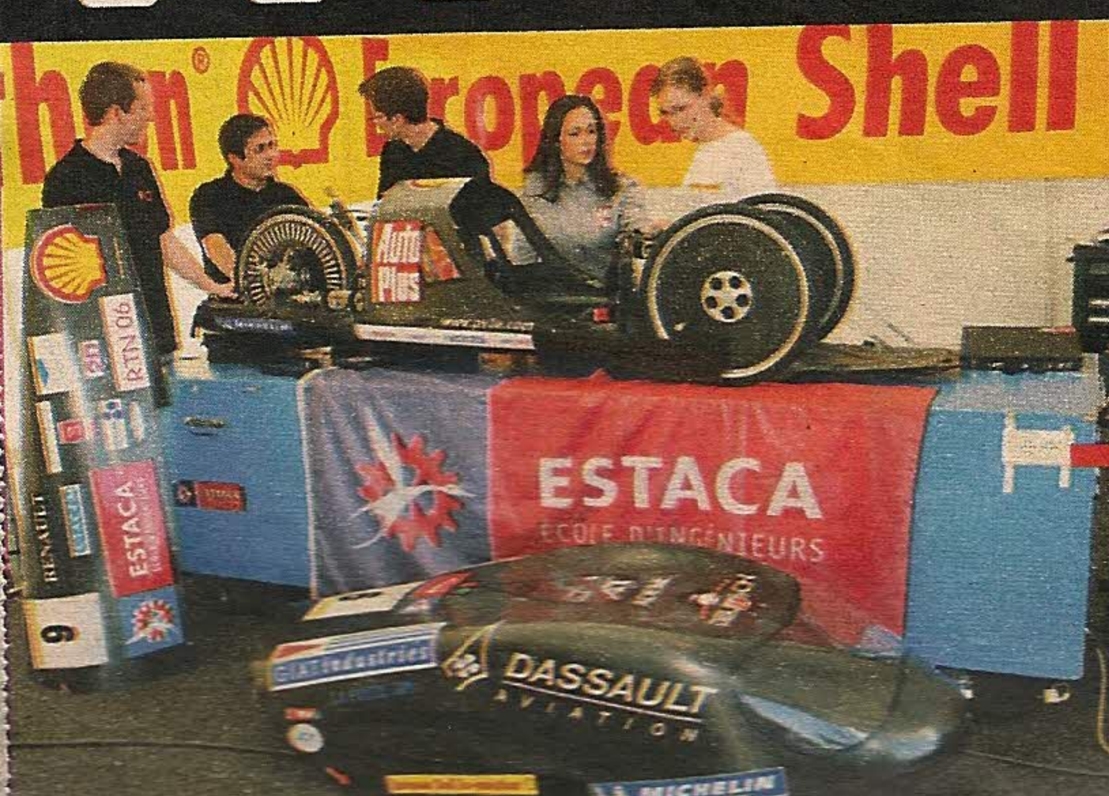
On s'active dans les stads. Focus sur les entrailles de la bête. Peu d'espace...