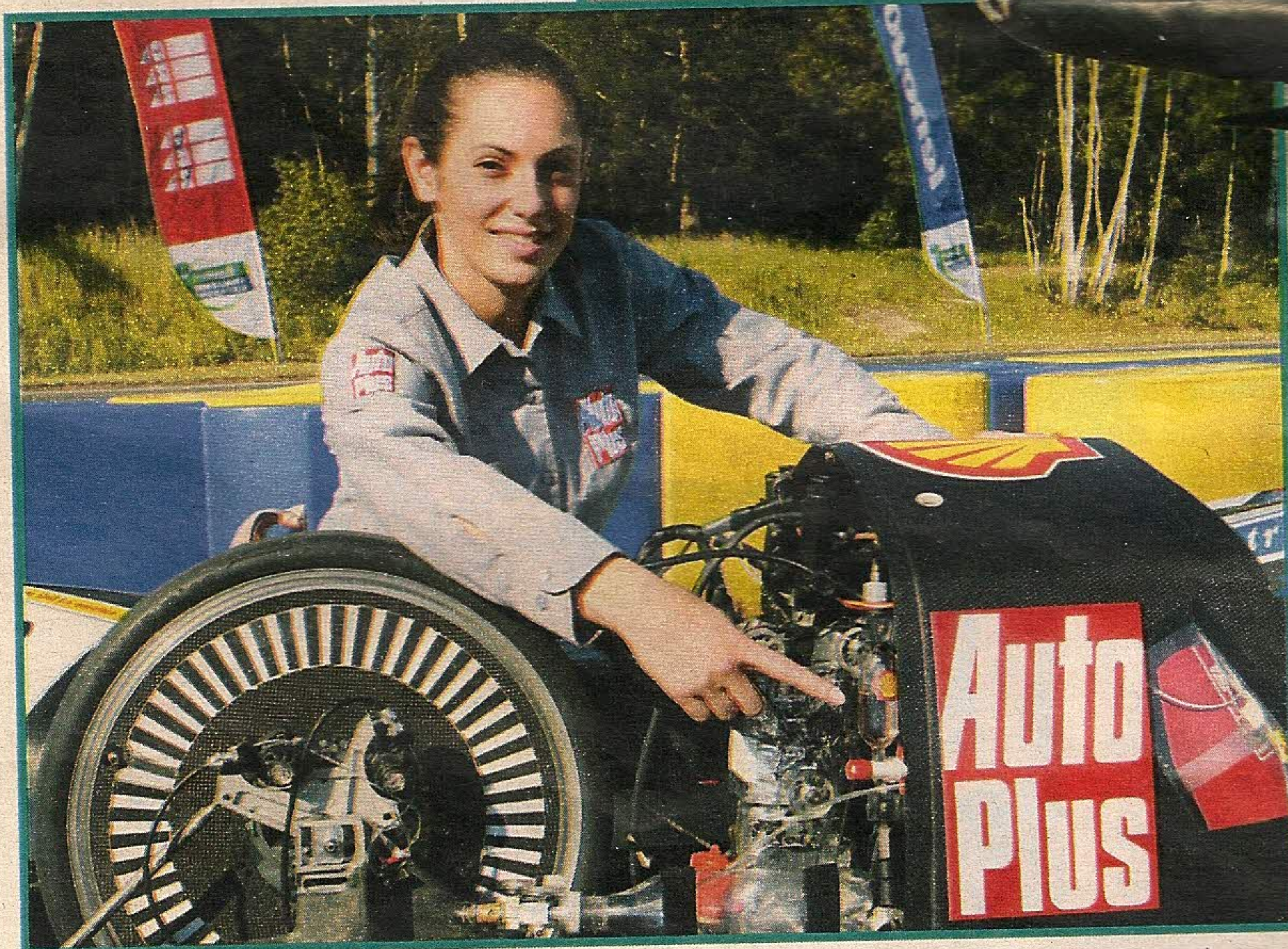
Sous le capot: un monocylindre 4 temps. Pour le nourrir, une fiole de 30 ml remplie de sans-plomb.

je m'assois doucement. Je rentre les jambes l'une après l'autre, en les pliant au maximum sans tirer sur les fils du guidon. Un véritable exercice de contor-