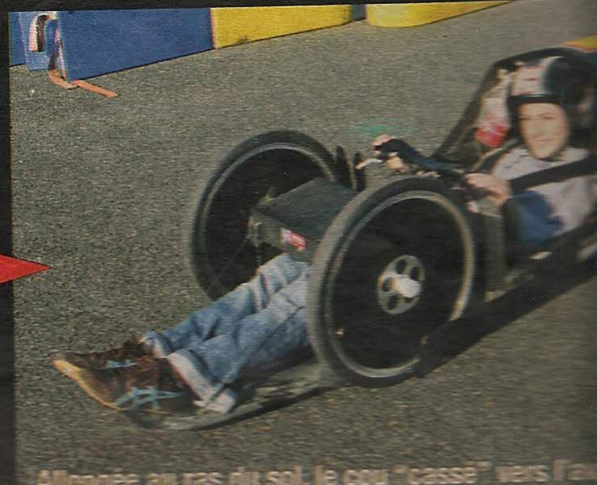
Allongée au ras du sol, le cou "cassé" vers l'avant, une position vraiment inhabituelle...