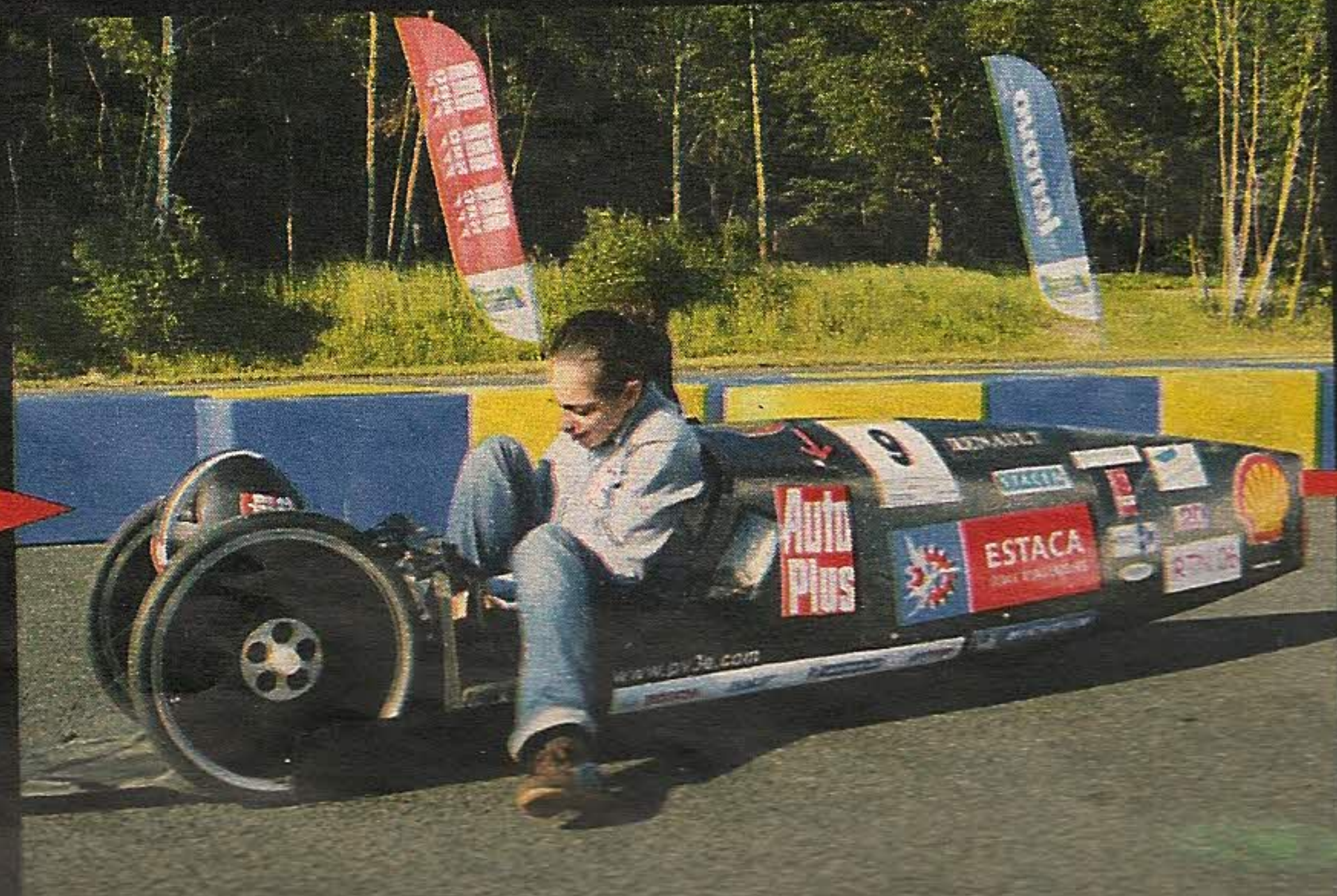
Séance de contorsions pour s'installer à bord.